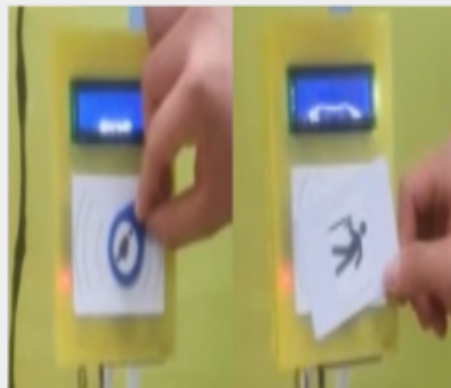
RFID센서에 노약자/임산부 카드 인식