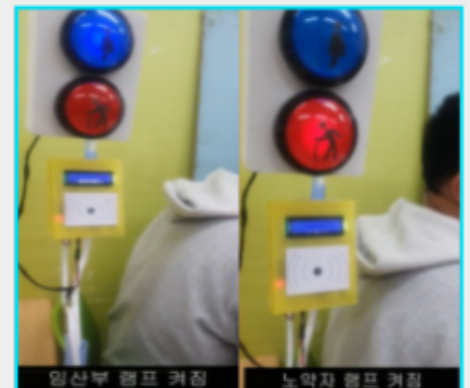
임산부 램프 켜짐 노약자 램프 켜짐 주변에 노약자/임산부임을 LED램프와 LCD화면으로 알림