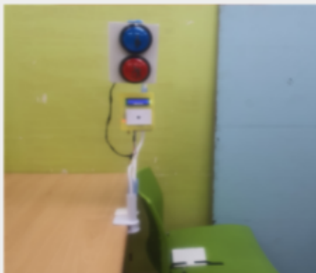
RFID센서를 노약자/임산부 배려석에 장착