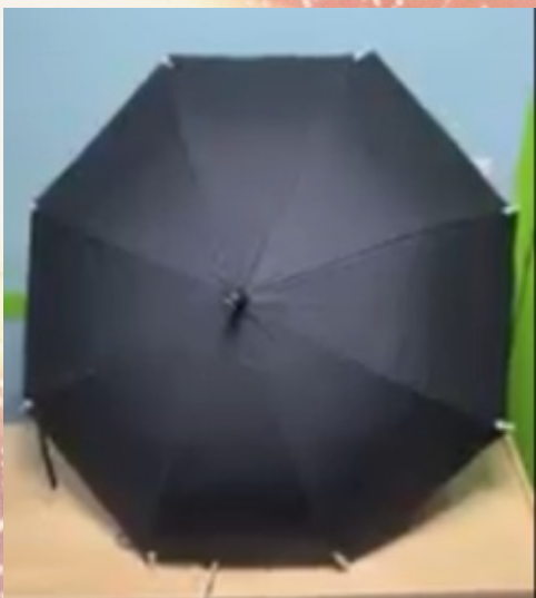
불이 켜지지 않음 상태